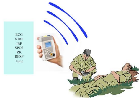
شکل ۲) سیستم ارسال گزارش از وضعیت بیمار

بنابراین یک سیستم تله متری طراحی شده برای مناطق عملیاتی باید یا دارای بستری مناسب برای ارسال علائم حیاتی باشد. هم اکنون مناسبترین بستر برای فعالیت های نظامی، فیبر نوری است که باید زیرساخت های آن از قبل فراهم شده باشد.