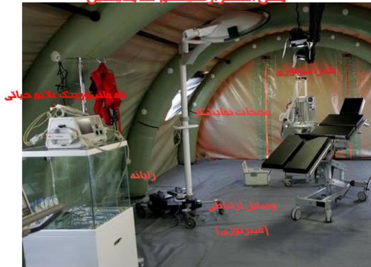
شکل (۱) محل استقرار سیستم تله مدیسین

ماهیت محل استقرار سیستم تله مدیسین، Store and Forward است. اما در مناطق جنگی این ارتباط به صورت Real Time تغییر می کند. زیرا در لحظات بحرانی زمان فاکتور بسیار مهمی است. بنابراین استفاده از تجهیزات مخابراتی پرسرعت در احداث یک محل مناسب برای استقرار سیستم بسیار کارآمد خواهد بود.