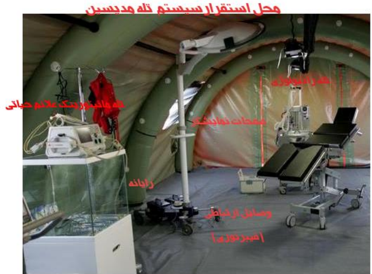
شکل (۱) محل استقرار سیستم تله مدیسین

ماهیت محل استقرار سیستم تله مدیسین، Store and Forward است. اما در مناطق جنگی این ارتباط به صورت Real Time تغییر می کند. زیرا در لحظات بحرانی زمان فاکتور بسیار مهمی است. بنابراین استفاده از تجهیزات مخابراتی پرسرعت در احداث یک محل مناسب برای استقرار سیستم بسیار کارآمد خواهد بود.