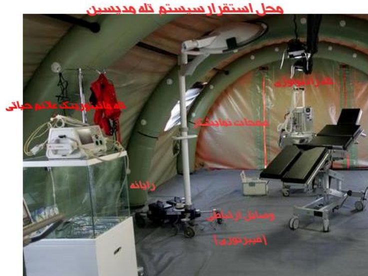
شکل (۱) محل استقرار سیستم تله مدیسین

ماهیت محل استقرار سیستم تله مدیسین، Store and Forward است. اما در مناطق جنگی این ارتباط به صورت Real Time تغییر می کند. زیرا در لحظات بحرانی زمان فاکتور بسیار مهمی است. بنابراین استفاده از تجهیزات مخابراتی پرسرعت در احداث یک محل مناسب برای استقرار سیستم بسیار کارآمد خواهد بود.