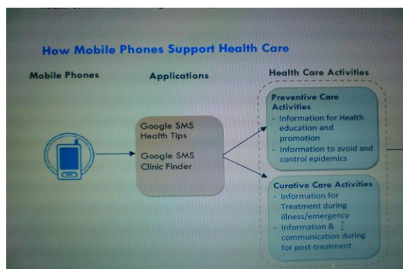
شکل ۲- عملکرد تلفن همراه در مراقبت بهداشتی