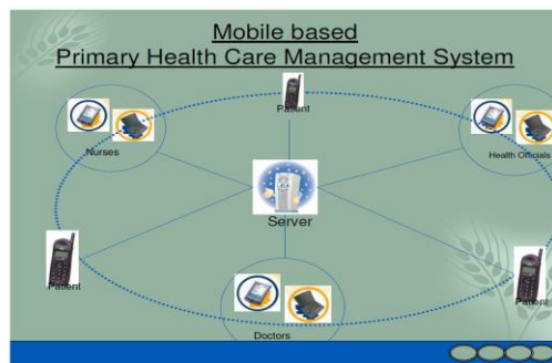
شکل ۳- سیستم مراقبت بهداشتی اولیه مبتنی بر تلفن همراه

شهر الکترونیک Bangalore توسعه "سیستم مراقبت اولیه بهداشتی مبتنی بر تلفن همراه" را برای به کارگیری در PHC به منظور بهتر کردن مدیریت مراقبت بهداشتی اولیه به خصوص در مناطق زاغه نشین شهری و روستایی آغاز نمود. این سیستم از اطلاعات کامل مربوط به بیماران درمان شده در یک PHC به دست خواهد آمد. این نرم افزار از توسعه مدیریت پایگاه داده بیمار، تعامل بین پزشک و بیمار، دستیابی به داده های پزشکی مثل ECG، تصاویر قلب، ریه، چشم و غیره و مدیریت برنامه ریزی تشکیل شده است [۳].