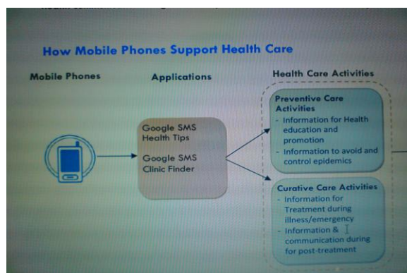
شکل ۲- عملکرد تلفن همراه در مراقبت بهداشتی