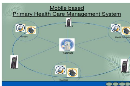
شکل ۳- سیستم مراقبت بهداشتی اولیه مبتنی بر تلفن همراه

شهر الکترونیک Bangalore توسعه "سیستم مراقبت اولیه بهداشتی مبتنی بر تلفن همراه" را برای به کارگیری در PHC به منظور بهتر کردن مدیریت مراقبت بهداشتی اولیه به خصوص در مناطق زاغه نشین شهری و روستایی آغاز نمود. این سیستم از اطلاعات کامل مربوط به بیماران درمان شده در یک PHC به دست خواهد آمد. این نرم افزار از توسعه مدیریت پایگاه داده بیمار، تعامل بین پزشک و بیمار، دستیابی به داده های پزشکی مثل ECG، تصاویر قلب، ریه، چشم و غیره و مدیریت برنامه ریزی تشکیل شده است [۳].