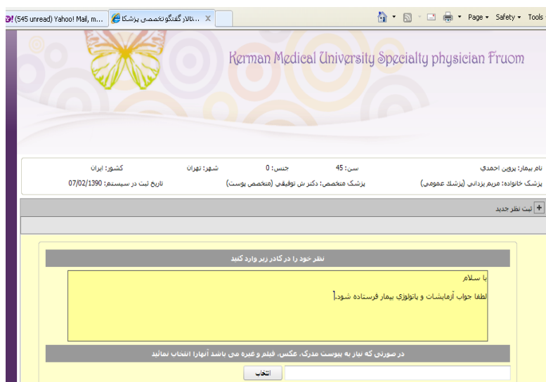
تصویر شماره ۵ ثبت دستورات بالینی توسط پزشک متخصص

پزشک خانواده در هر بار ورود به سیستم بر اساس فیلد وضعیت بیمار می تواند متوجه شود که پرونده الکترونیکی بیمار مورد نظر در چه مرحله ای است. (تصویر شماره ۶)