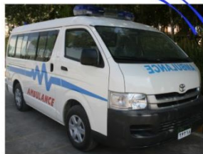
شکل ۴) شناسایی مکان آمبولانس حامل مجروح

در مناطق عملیاتی و در لحظات بحران سیستم های ردیابی بسیار کارآمد هستند. سیستم های ردیابی برای شناسایی مکان دقیق آمبولانس حامل مجروح، درمانگاه الکترونیکی سیار و حتی خود مجروح استفاده می شود.