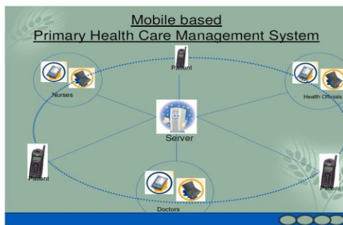
شکل ۳- سیستم مراقبت بهداشتی اولیه مبتنی بر تلفن همراه

شهر الکترونیک Bangalore توسعه "سیستم مراقبت اولیه بهداشتی مبتنی بر تلفن همراه" را برای به کارگیری در PHC به منظور بهتر کردن مدیریت مراقبت بهداشتی اولیه به خصوص در مناطق زاغه نشین شهری و روستایی آغاز نمود. این سیستم از اطلاعات کامل مربوط به بیماران درمان شده در یک PHC به دست خواهد آمد. این نرم افزار از توسعه مدیریت پایگاه داده بیمار، تعامل بین پزشک و بیمار، دستیابی به داده های پزشکی مثل ECG، تصاویر قلب، ریه، چشم و غیره و مدیریت برنامه ریزی تشکیل شده است [۳].