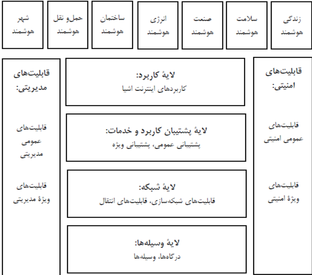
شکل ۱. مدل معماری اینترنت اشیا اتحادیه بین‌المللی ارتباطات