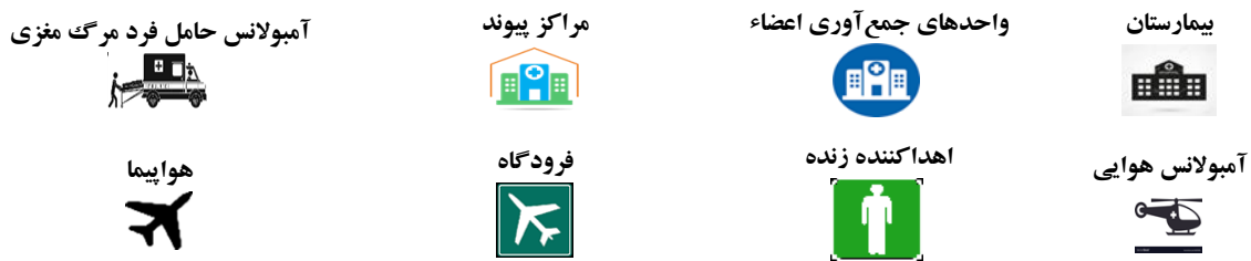
شکل ۲. طرح شماتیک مسئله

تابع هدف اول زمان انتقال اهداکننده از بیمارستان به واحد جمع آوری اعضاء و مرکز پیوند، زمان انتقال دریافت کنندگان عضو در منطقه مورد بررسی به مرکز پیوند جهت دریافت عضو، زمان انتقال عضو از واحد جمع آوری اعضاء به مرکز