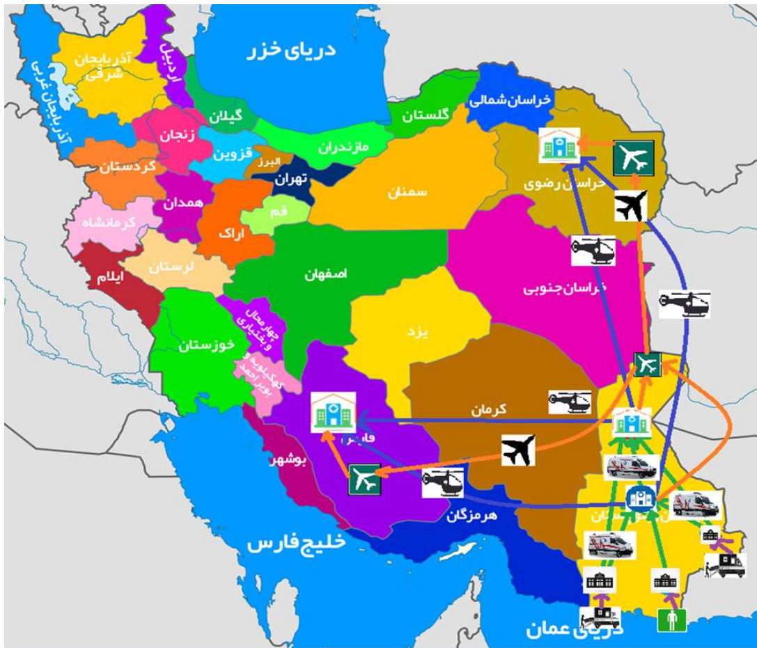
شکل ۱. شبکه‌ی زنجیره تأمین پیوند عضو