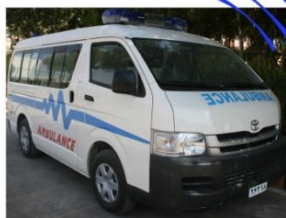
شکل ۴) شناسایی مکان آمبولانس حامل مجروح

در مناطق عملیاتی و در لحظات بحران سیستم های ردیابی بسیار کارآمد هستند. سیستم های ردیابی برای شناسایی مکان دقیق آمبولانس حامل مجروح، درمانگاه الکترونیکی سیار و حتی خود مجروح استفاده می شود.