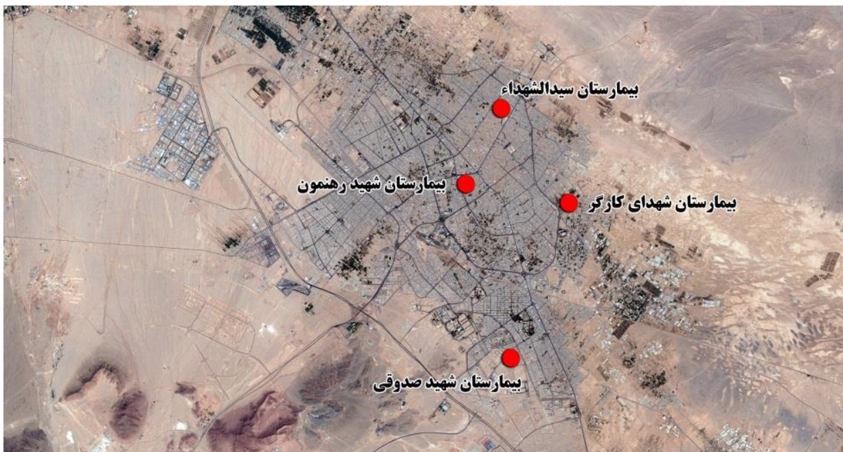
تصویر ۱- موقعیت نمونه‌های مورد مطالعه در شهر یزد

نمونه مورد مطالعه در این پژوهش بیمارستان‌های دولیت در شهر یزد می‌باشند. به همین منظور ۴ بیمارستان به‌منظور تکمیل پرسشنامه از بیماران در نقاط مختلف شهر که دارای