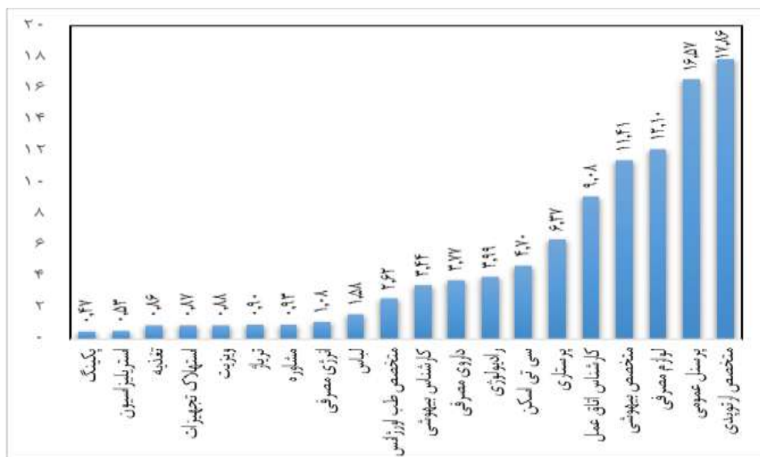
نمودار ۱. درصد هزینه بری هر یک از عوامل هزینه عمل جراحی شکستگی فمور