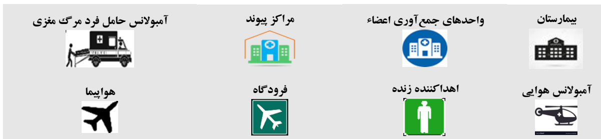
شکل ۲- طرح شماتیک مسئله

تابع هدف اول زمان انتقال اهداکننده از بیمارستان به واحد جمع‌آوری اعضاء و مرکز پیوند، زمان انتقال دریافت‌کنندگان عضو در منطقه مورد بررسی به مرکز پیوند جهت دریافت عضو، زمان انتقال عضو از واحد جمع‌آوری اعضاء به مرکز