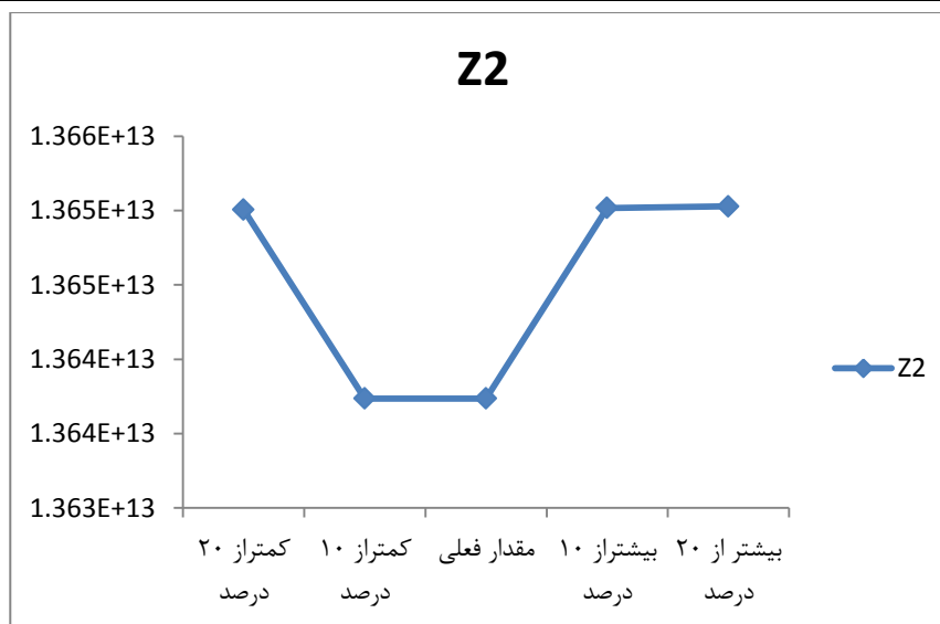
شکل ۴- تغییرات تابع هدف هزینه در اثر تغییر تقاضا

می‌دهد که در کدام نقطه‌ی کاندید (کدام نقطه از هر شهرستان) مراکز جمع‌آوری اعضا و مراکز پیوند عضو تأسیس گردد و کدام مناطق به حمل‌هوایی مستقیم مجهز گردد.